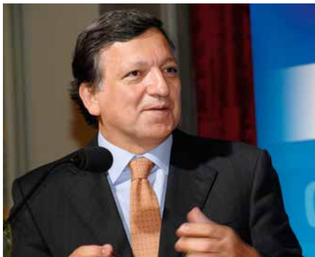
José Manuel Barroso, Präsident der Europäischen Kommission

Als „Europatriate“ begrüße ich diese Initiative zur Lösung eines der dringlichsten Probleme im heutigen Europa – der dramatisch hohen Zahl junger Menschen in Europa, die keine Arbeit finden.